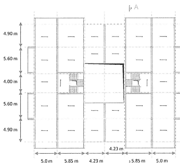
CARPENTERIA PIANO TIPO

È prevista una campagna di prove finalizzata alla conoscenza e alla valutazione della sicurezza dell'edificio in calcestruzzo armato descritto schematicamente in figura. Il candidato proponga un progetto delle prove, illustrando gli obiettivi, le tecniche di indagine, la strumentazione richiesta e le principali problematiche connesse all'interpretazione dei dati sperimentali.