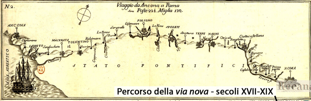
Percorso della via nova - secoli XVII-XIX