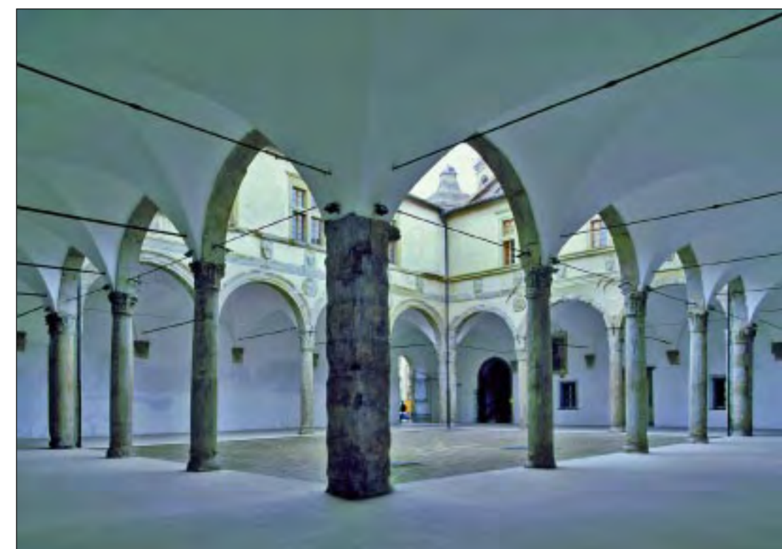
Università di Camerino Cortile d'onore del Palazzo Ducale (Secolo XV)

21.30 Partecipazione alla rievocazione storica Offerta dei Ceri - Corsa alla Spada e Palio