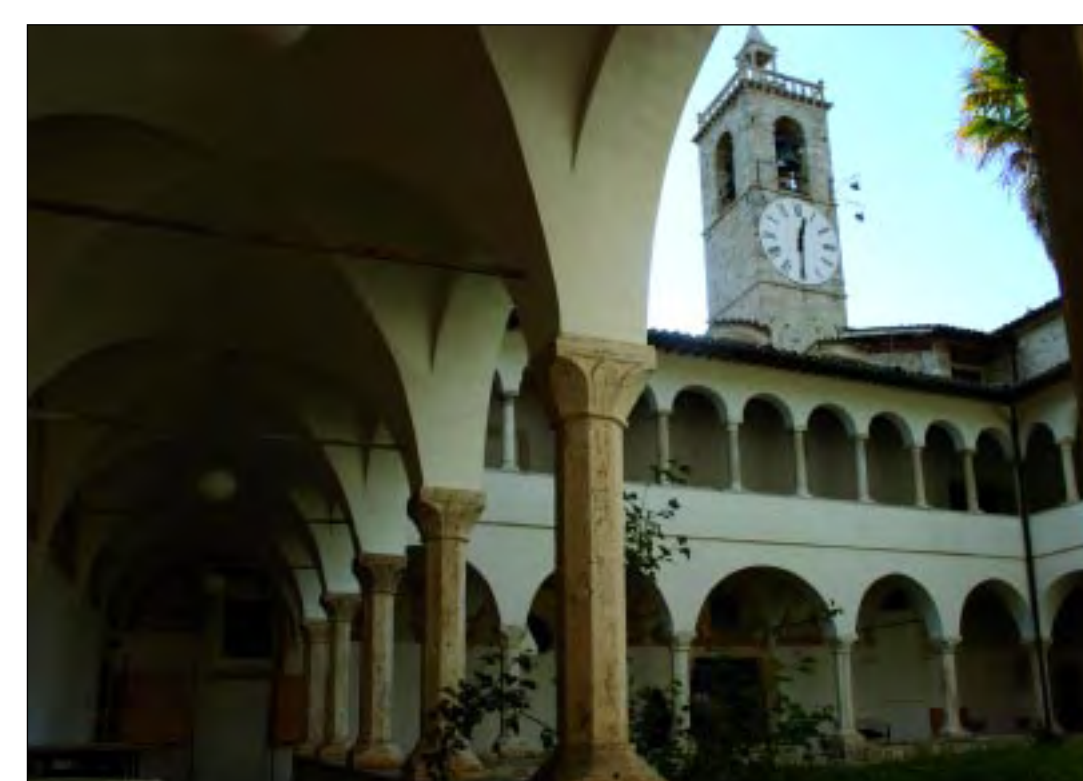
Ascoli Piceno, ex Convento dell'Annunziata sede della Scuola di Architettura e Design UNICAM